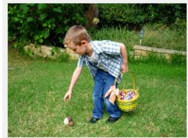
Chasse aux oeufs de Pâques